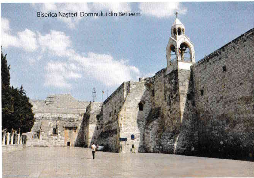
Biserica Nașterii Domnului din Betleem

Și toate au început cu Crăciunul. Din ziua aceea lumea n-a mai fost niciodată la fel. Și n-avea să se mai întoarcă în legile cele vechi ale legământului trecut vreodată, căci Soarele Dreptății a răsărit prin Nașterea Ta să aducă lumina mântuirii pentru fiecare dintre noi: niciodată nu va mai fi la fel. Că Prunc ni S-a născut spre mântuire, Hristos a înviat și noi vom învia pentru că S-a născut în piele și-n carne de om, chipul omenesc luându-și, ca să ne putem privi pe noi înșine în ochii veșnici, ăia de-i crezuserăm pierduți pentru totdeauna!